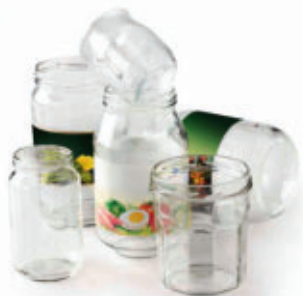
Les pots et bocaux sans couvercle