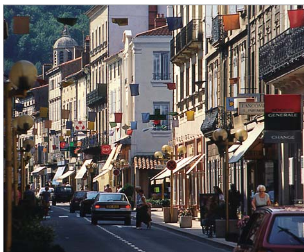
Tab. 1 : hypermarchés et supermarchés (mars 05)

Non compris : - commerce et réparation automobile - commerce de gros